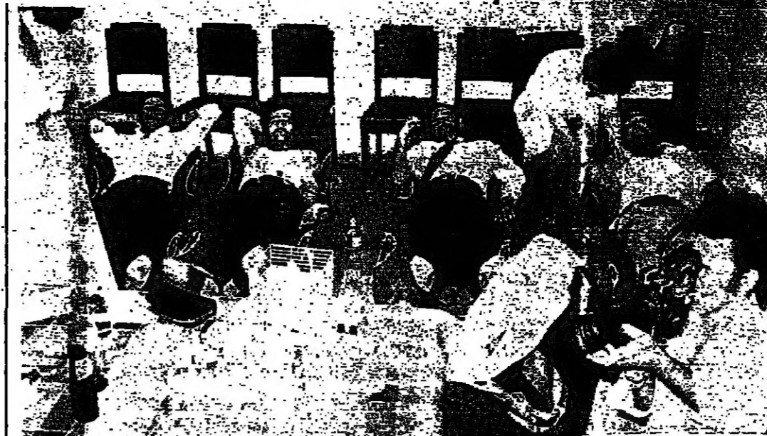
مجموعة من الشباب يتبرعون بالدم في قصر الابن مجد ارسلان